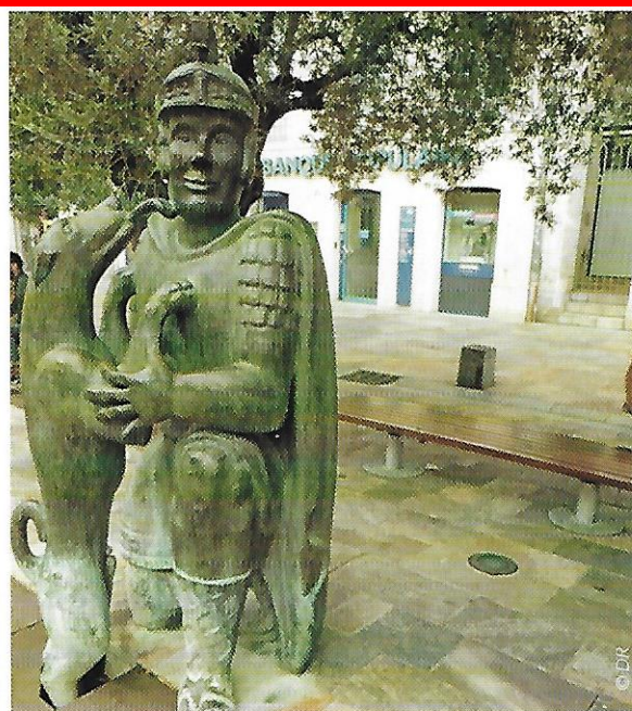
Statue légionnaire romain à Dax.