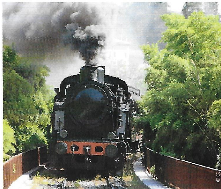
Le train des Cévennes à Anduze.